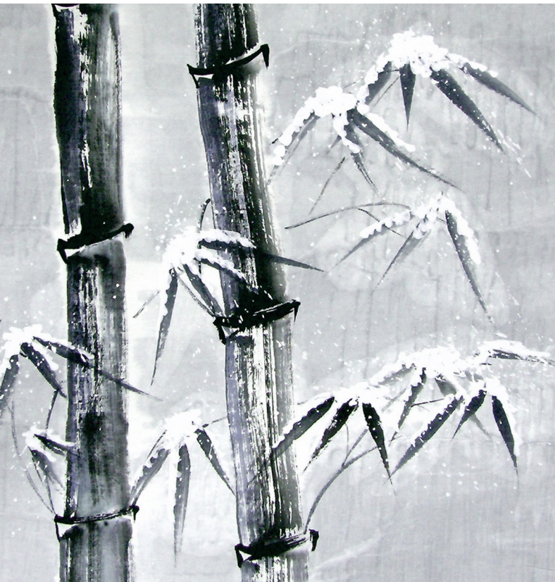
Mechthild Trimborn, Winter, Tusche, 80 x 50 cm, Ausschnitt